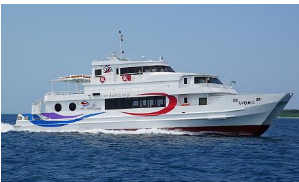
【安栄観光が運航する船舶】