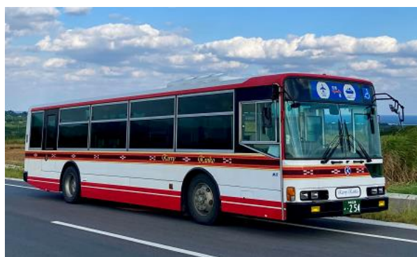
【カーリー観光が運行する路線バス】