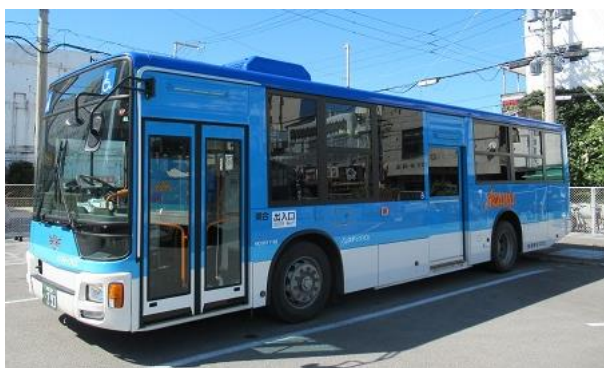
【東運輸が運行する路線バス】